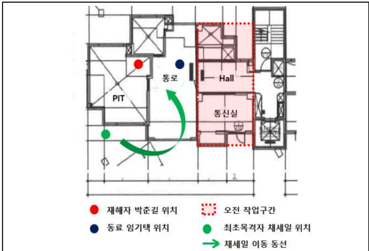
[그림1] 재해발생 평면도