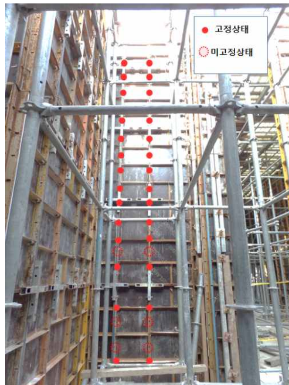
[사진2] 플랫타이 및 웨지핀 고정 작업상황